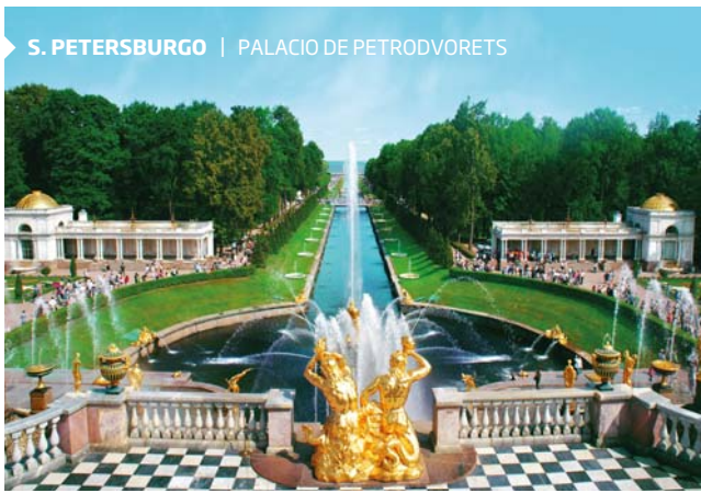
S. PETERSBURGO | PALACIO DE PETRODVORETS