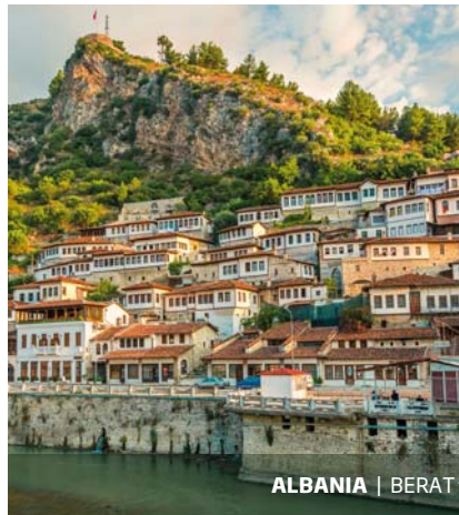
ALBANIA | BERAT