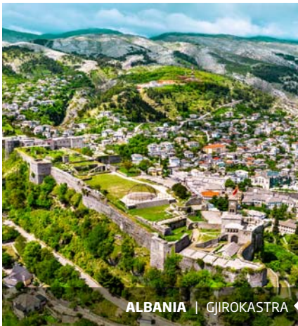
ALBANIA | GJIROKASTRA

Recogida de equipajes y traslado en autocar hasta Vigo. Fin del viaje y de nuestros servicios.