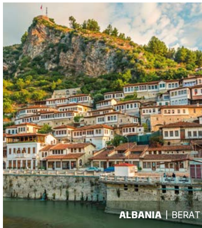
ALBANIA | BERAT